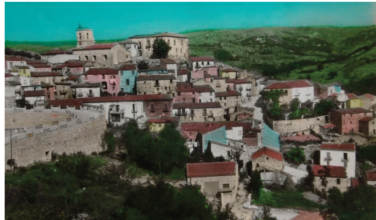
Fossalto (CB), cartolina anni Sessanta

lingua della corallità rurale, cede al silenzio; senza più fiato né metrica, la poesia non ha più parole per tramandare la memoria. Anche il “calle de core” è spento: la guerra ha atomizzato gli individui, spegnendo l'empatia. Il verso isolato “Niente.” cade allora come un verdetto tombale che recide ogni speranza. Il cuore della lirica si sviluppa poi in un finto dialogo drammatico — “- E tu? e tu? e quille? / Niente.” — dove la frammentazione dei pronomi evidenzia la dissoluzione della comunità. Scomparso il “noi”, restano individualità isolate che si interrogano nel vuoto, ottenendo come unica risposta la reiterazione del nulla. Il testo culmina nella celebre definizione della guerra come “Finitoria de munne”, crollo verticale dell'intero sistema di valori contadino. La chiusa consegna infine un'immagine di raggelante potenza: “L'ucchie sbauttite / iè ssutte”. Lo sbigottimento di fronte all'orrore è talmente profondo da superare il pianto; le lacrime sono finite e l'occhio, prosciugato e asciutto, sigilla l'impossibilità di elaborare il lutto. Se il