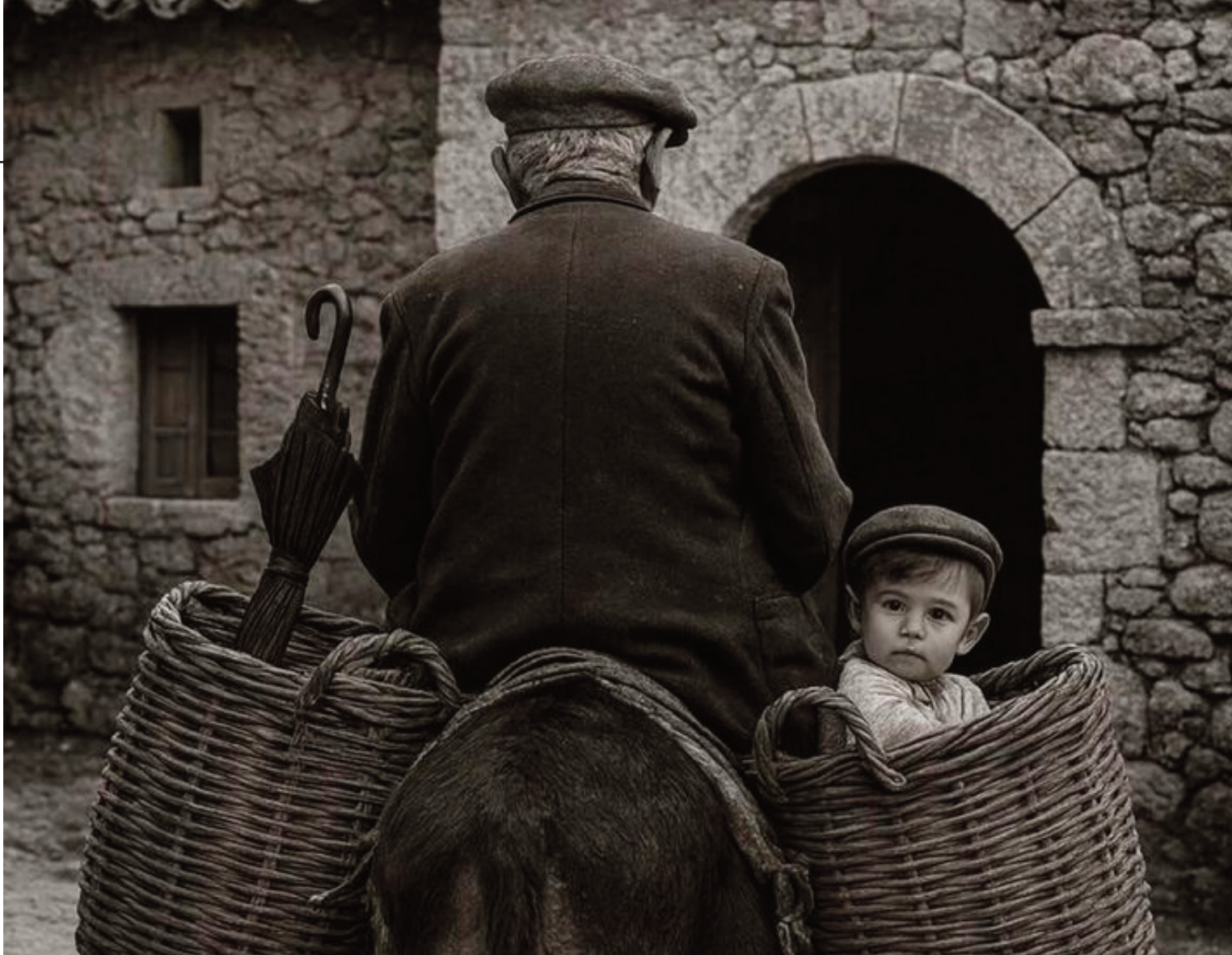
Scena di vita molisana

farsi manifesto assoluto di un azzeramento esistenziale e linguistico. Il testo si configura come una tela violentemente strappata, sulla quale la brutalità della storia ha cancellato ogni traccia di colore e di speranza, riducendo l'esperienza umana al grado zero della parola.