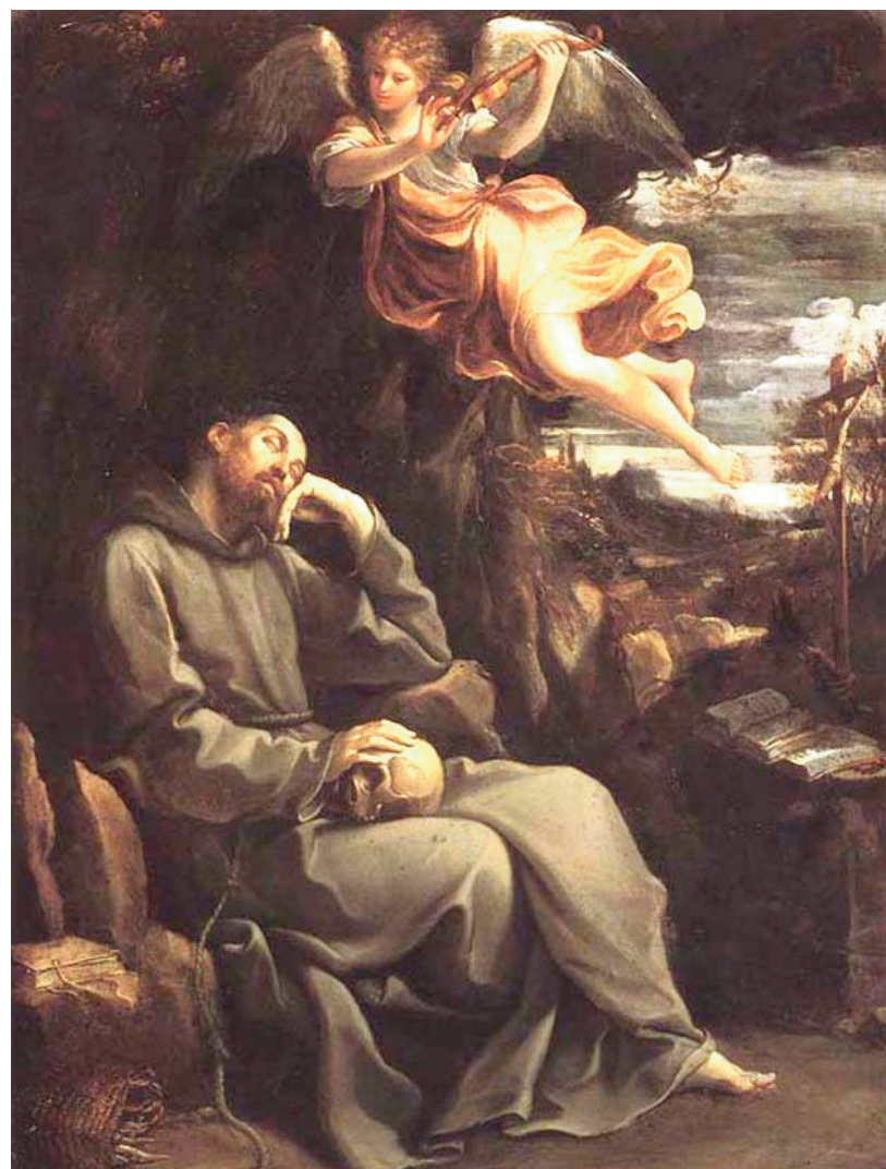
San Francesco di Guido Reni

Francesco non è diventato triste, è diventato consapevole. E la consapevolezza, quando arriva senza essere cercata, assomiglia molto alla solitudine. In casa, il padre continua a muoversi con la sicurezza di chi non ha mai imparato a dubitare. Pietro di Bernardone parla di affari, di opportunità e di futuro come se la vita fosse una strada già tracciata, da percorrere senza mai fermarsi. Per lui ogni deviazione è un rischio, ogni esitazione una perdita, ogni rallentamento un errore. Quando guarda Francesco, non vede un figlio ferito; vede un giovane che deve semplicemente tornare quello di prima, il ragazzo brillan-